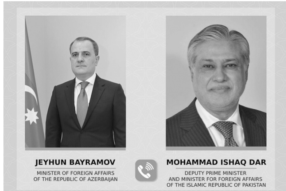
JEYHUN BAYRAMOV MINISTER OF FOREIGN AFFAIRS OF THE REPUBLIC OF AZERBAIJAN

Əlbəttə, nazirlərin telefon söhbəti göstərir ki, hər iki qardaş ölkə beynəlxalq məsələlərdə də ortaq maraqlardan çıxış edirlər. Qeyd edək ki, iki ölkə arasında əlaqələr son illərdə daha da irəliləyərək yeni mərhələyə daxil olub. Azərbaycan - Pakistan münasibətləri birgə tarix, mədəniyyət, din, həmrəylik və qarşılıqlı dəstək üzərində qurulub, uğurla da davam etdirilir. Hər iki dövlət münasibətlərinin yüksəlmə xətlə inkişafına həm dövlətlər səviyyəsində qətiyyətli siyasi iradə nümayiş etdirilib, həm də cəmiyyətlərin yüksək konsolidasiyası diqqəti cəlb edir. Hər zaman bildirildiyi kimi, Pakistan və Azərbaycan çiyin-çiyinə dayanan ölkələr sayılır. Təsəvvüf deyil ki, Prezident İlham Əliyevin 2024-cü ildə Pakistan İslam Respublikasına dövlət səfəri çərçivəsində mətbuata açıqlamasında Pakistanın Baş naziri Məhəmməd Şahbaz Şərif məmnunluğunu belə ifadə etmişdi: "Buraya eniş etdikdən bəri Pakistan xalqı Sizi tele-